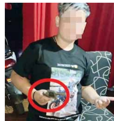
Antecedentes. El niño tenía una causa anterior por encubrimiento.