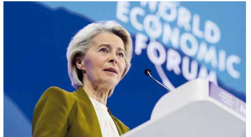
Firmeza. Ursula von der Leyen calificó de "error" los aranceles de Trump.

"Con Groenlandia, no hemos amenazado a nadie, hemos apoyado a un aliado, Dinamarca", dijo