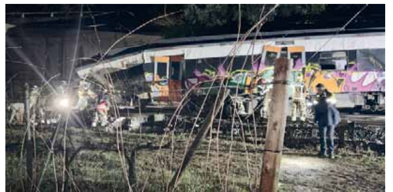
Maquinista. Fue la víctima de un accidente en Barcelona tras la caída de un muro de contención.

Por el descarrilamiento en Barcelona, las primeras hipótesis apuntan a las fuertes lluvias que han azotado Cataluña durante los