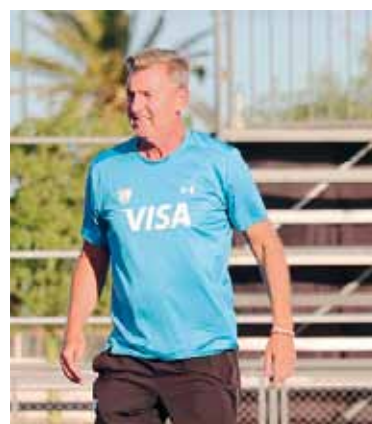
Enfoque. Preparación en marcha.

El debut será el 10 ante Irlanda a las 5.30; el 11 enfrentarán a Aus-