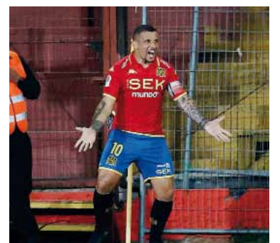
¡De locos! El chileno se muere por vestir la azulgrana.

Las declaraciones aparecieron en un contexto particular: San Lorenzo viene de levantar inhibiciones que le impedían incorporar refuerzos y, al mismo tiempo, el jugador atraviesa un conflicto con Unión Española de Chile, club que lo había presentado hace apenas tres