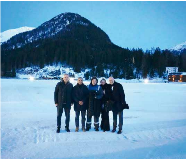
En el lugar. La comitiva argentina arribó ayer a Davos.