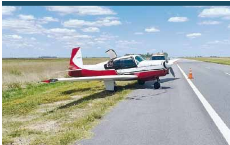
Una avioneta debió realizar un aterrizaje de emergencia sobre ruta provincial 56, a la altura de General Madariaga, cerca de Pinamar, por una falla en el motor. Por fortuna no hubo heridos y el tránsito en la zona no tuvo inconvenientes. - DIB -