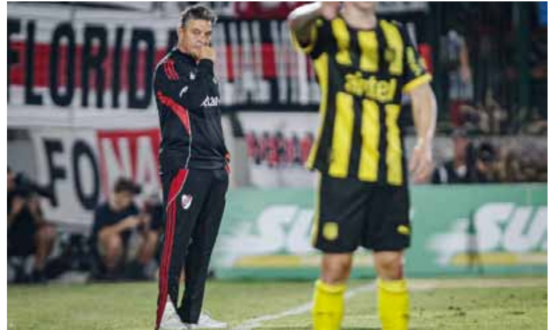
Ajustes. El DT ultima el once inicial.

El cuerpo técnico resolvió preservar a Acuña, quien arrastra un pisotón sufrido ante Racing Club de Avellaneda el 24 de noviembre pasado y no pudo completar la pretemporada. Sin ritmo físico ni futbolístico, el defensor se perdió los amistosos frente a Millonarios y Peñarol, situación que llevó a Gallardo a postergar su regreso oficial. En contrapartida, Viña ten-