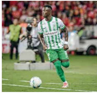
Revés. El delantero jugará en Vasco da Gama.

El desenlace dejó al "Xeneize" sin margen de maniobra, con el mercado de pases prácticamente cerrado y un frente de ataque debilitado por las lesiones. Miguel Merentiel sufrió un desgarró ante Olimpia y estará al menos tres semanas fuera de las canchas, baja que se suma a las de Edinson Cavani, afectado por una lumbalgia,