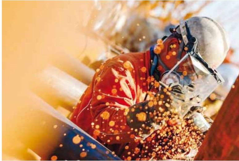
Panorama. La actividad metalúrgica cerró otro año en rojo.