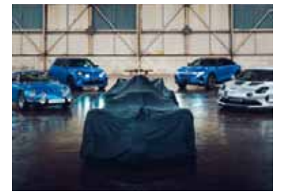
Sobre un crucero en el mar Balear.

Franco Colapinto será una de las grandes caras del lanzamiento del Alpine A526, el nuevo monoplaza con el que la escudería francesa afrontará la temporada 2026 de la Fórmula 1. A pocas semanas del inicio del campeonato, el equipo confirmó una presentación poco convencional: el auto será mostrado el viernes en un evento exclusivo montado sobre un crucero en el mar Balear, frente a la costa de Barcelona.