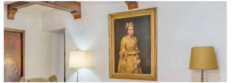
Perdido y hallado. La fotografía de la inmobiliaria marplatense donde se veía el cuadro.

Una pericia confirmó la autoría y el origen de la obra que estaba en una casa en Mar del Plata, expoliada al galerista judío Jacques Goudstikker.