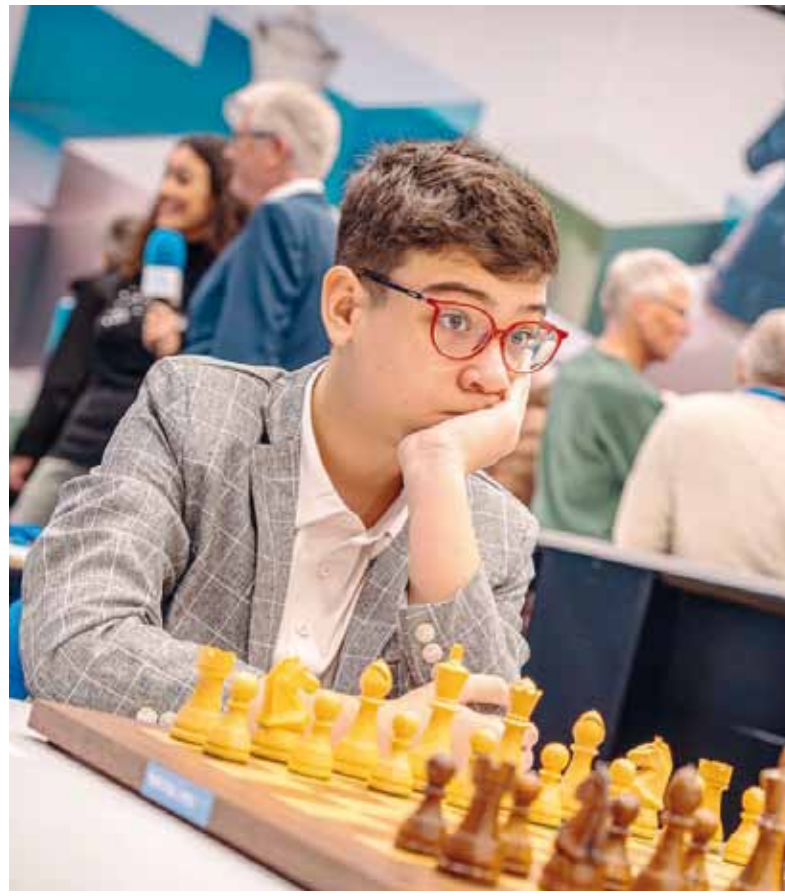
Firme. Auspicioso desempeño del bonaerense en Países Bajos.

El Challenger del Tata Steel reúne a Grandes Maestros consolidados y a jóvenes promesas del ajedrez mundial, y es considerado uno de los torneos más exigentes del circuito internacional. Además, el ganador obtiene una